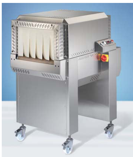
Ruote opzionali - Optional wheels - Roulettes en option - Optionale Räder - Ruedas opcionales